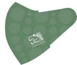
F:水イメージ (グリーン)