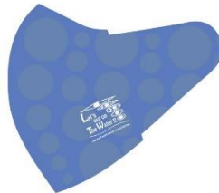
E:水イメージ (ブルー)