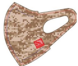
D:デジタルカモフラージュ（ベージュ）