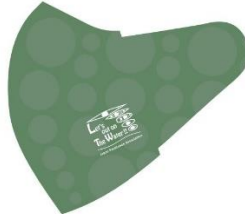
F:水イメージ（グリーン）