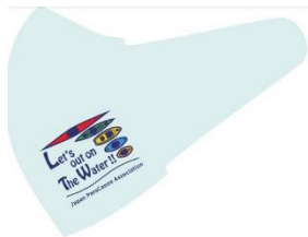
B:協会オリジナルロゴ（薄いブルー）