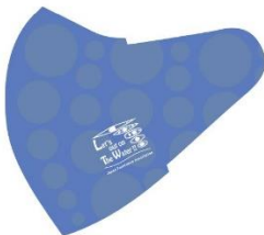
E:水イメージ（ブルー）